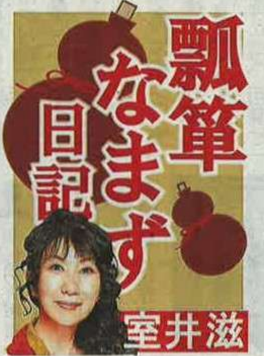
むろい・しげる 女優、エッセイスト、富山県出身

新型コロナウイルスの感染症法上の位置づけが2類から5類へ移行と正式に決まった。5月8日から季節性インフルエンザなどと同じ扱いに。